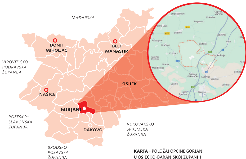
KARTA - POLOŽAJ OPĆINE GORJANI U OSJEČKO-BARANJSKOJ ŽUPANIJI